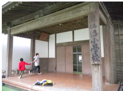
炊出し現場小学校