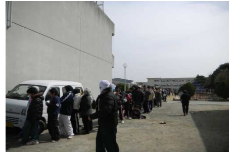
炊出し 1 時間後